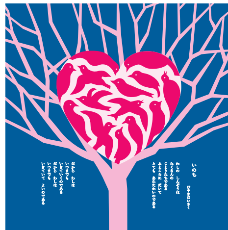
いのち/けやきだいさく