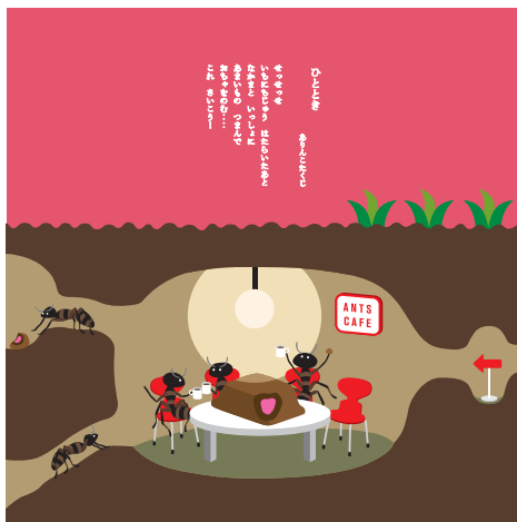
ひととき/ありんこたくじ