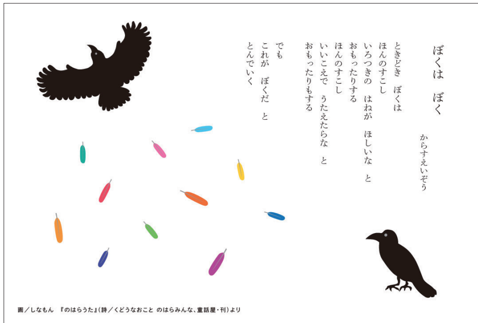
ぼくは ぼく/からすえいぞう

画/しなもん 『のはらうた』(詩/くどうなおこと のはらみんな、童話屋・刊)より